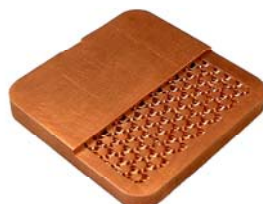
Pressure Drop / Thermal Resistance